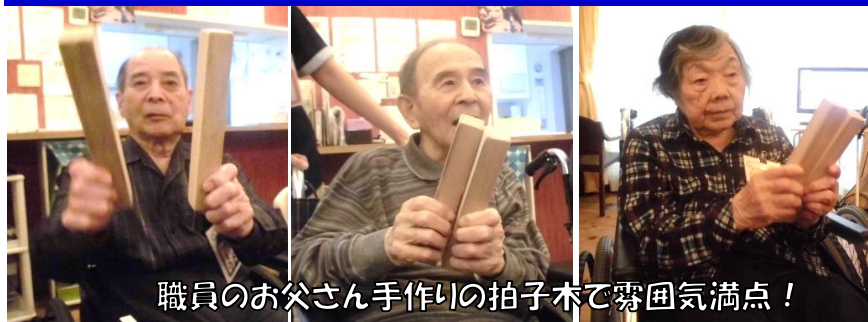
職員のお父さん手作りの拍子木で雰囲気満点！