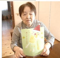
手形を押して 帽子と顔をつけ サンタ完成！