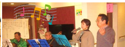
アゲインユースさんの演奏会