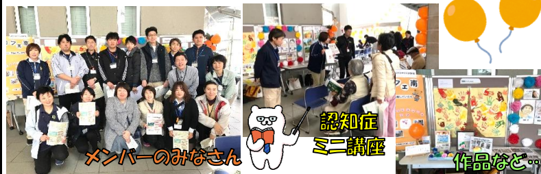
メンバーのみなさん

12/1 (日) 大野城福祉フェスティバルにて多くの方々に認知症を正しく知って頂く啓発活動として、大野城市内の地域密着型事業所合同で「らんらんブース」を出店しました。