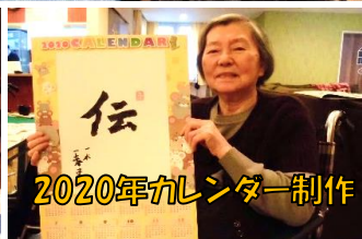
2020年カレンダー制作

ボランティアさんによる楽しい活動がたくさんありました。書道や音楽にふれる機会は、みなさまにとっても懐かしく心穏やかに過ごす時間になったのではないのでしょうか。