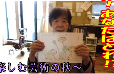
～書や絵を楽しむ芸術の秋～