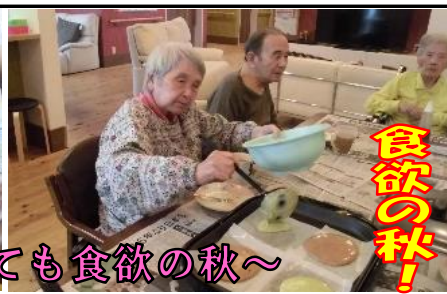
～なんととっても食欲の秋～

秋満喫と題して…食べること・運動すること・絵や書にふれることを意識して生活の中にたくさん取り入れてみました。得意なことや興味を持たれるものは皆違いますが、自分の楽しみを続けたり見つけたりすることが大切ですよね。