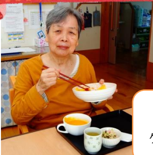
手作りのパンプキン ケーキとオムライスです